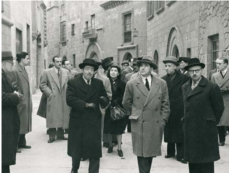
Pérez de Rozas / AHCB-AF

de la era cristiana; pero la respuesta de las autoridades municipales, formulada entre dudas e intrigas, fue negativa, y, sin definición oficial, comenzaron las obras de cimentación de la casa objeto del traslado, proyectadas a ciegas y con intención apresurada. Pronto crecieron implacables unos anchos muros de hormigón, que luego hubo que derribar. Mientras duraban las obras de la plaza del Rei, se tuvo que verificar el estado de los cimientos de la capilla de Santa Àgata porque se había desplomado la torre del campanario. Aprovechando los trabajos de excavación obligados por las investigaciones, fue posible estudiar, en 1934 y 1935, buena parte del subsuelo de la plaza, pero la guerra obligó a rellenar las excavaciones para protegerlas, pues había tareas más urgentes.