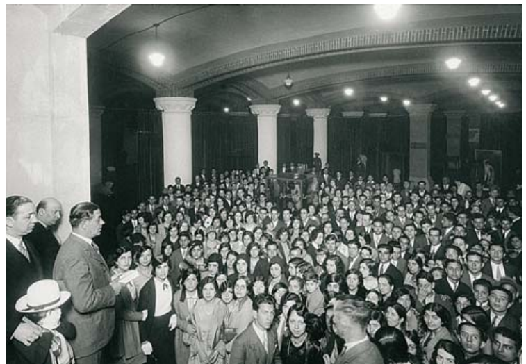
J. Domínguez / AHCB-AF