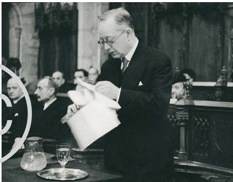
Pérez de Rozas / AHCB-AF